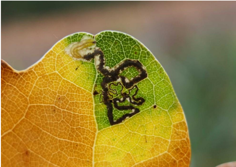
Rups van eikenmineermot in blad van zomereik. Op de foto is de mijn van de rups zichtbaar, hierin bevindt zich donkere poep. De rups is licht van kleur en bevindt zich bovenin op de foto.

leven binnen in bladeren waar ze het bladgroen eten. De late eikenmineermot leeft in bladeren van de zomereik en wintereik. Omdat er niet veel gezocht wordt naar deze kleine vlinders zou het best kunnen dat de late eikenmineermot algemener voorkomt dan nu wordt gedacht. De perenbladmineermot komt voor op onbespoten perenbomen, deze onbespoten perenbomen komen helaas maar weinig voor. Gelukkig worden er op tuinvereniging Ons Buiten geen chemische bestrijdingsmiddelen gebruikt en is de perenbladmineermot hier teruggevonden.