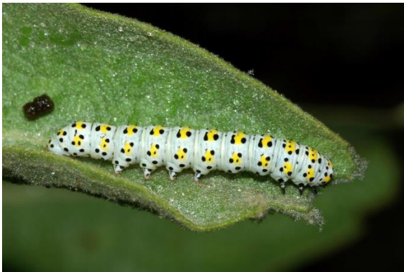
Rups kuifvlinder.

De kuifvlinder is als rups op tuinvereniging Ons Buiten waargenomen, dit is een zeldzame vlinder en komt vooral voor in de duinen en op de zandgronden in het binnenland. De rupsen zijn mooi gekleurd en hebben zwarte en gele stippen, de vlinder is daarentegen tamelijk grauw. De rupsen van de kuifvlinder zijn specialisten, dit betekent dat ze maar van één of enkele plantensoorten eten. De rupsen leven van helmkruid, toorts en ook wel van de vlinderstruik maar hebben een voorkeur voor toorts.