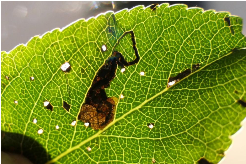
Mijn van perenbladmineermot in blad van peer.